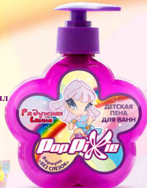
Пена для ванн «Радужная ванна», 250 мл