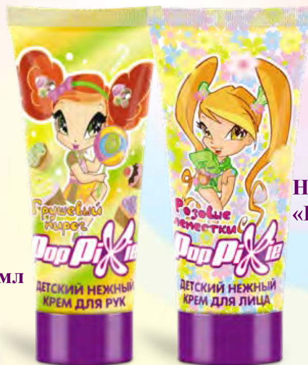
Нежный крем для рук «Грушевый пирог», 50 мл