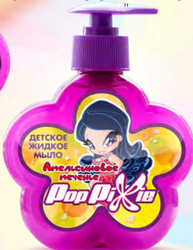
Детское жидкое мыло «Апельсиновое печенье», 250 мл