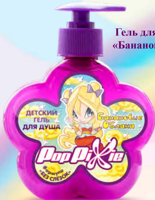
Гель для душа «Банановые облака», 250 мл