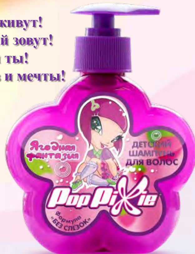
Детский шампунь «Ягодная фантазия», 250 мл