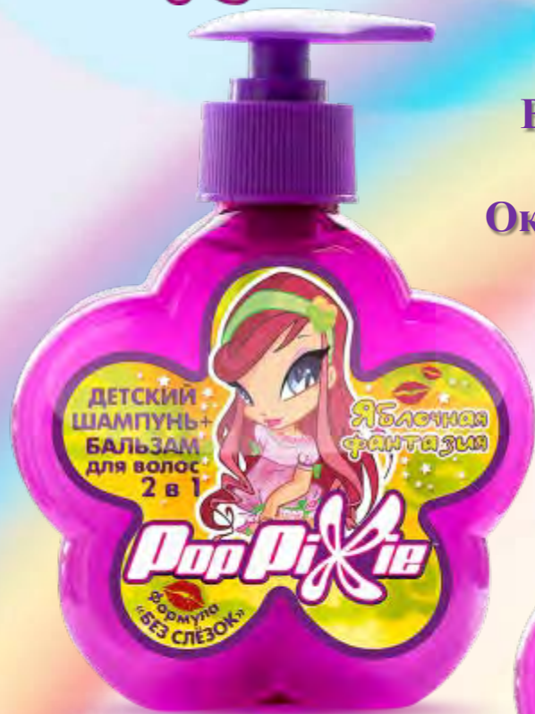
Детский шампунь+бальзам для волос 2 в 1 «Яблочная фантазия», 250 мл

В сказочном городе Пикси живут! В мир волшебства и фантазий зовут! Чудесной феей станешь и ты! Окупись в мир фантазий, грез и мечты!